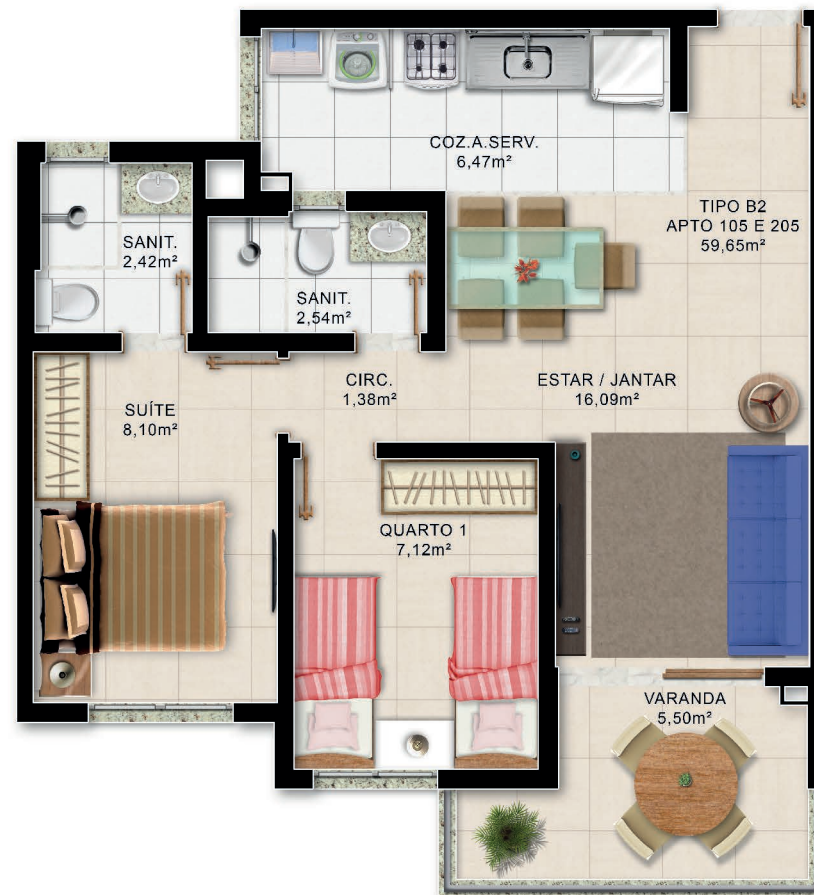
Planta Baixa 2/4 Superior 1º e 2º Pau. Tipo B2

*Área total privativa, áreas internas úteis