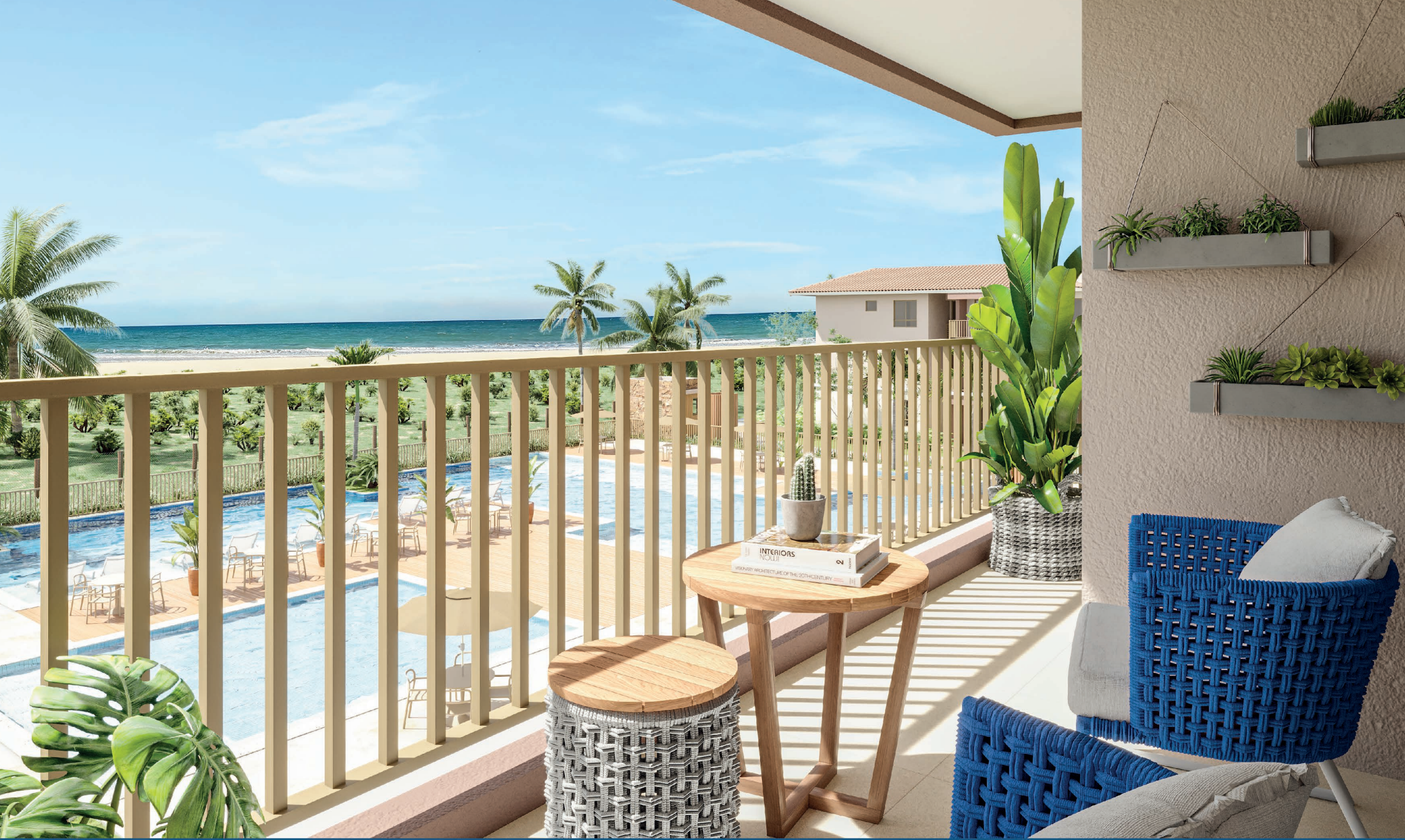
Varanda Superior 3/4 Tipo D