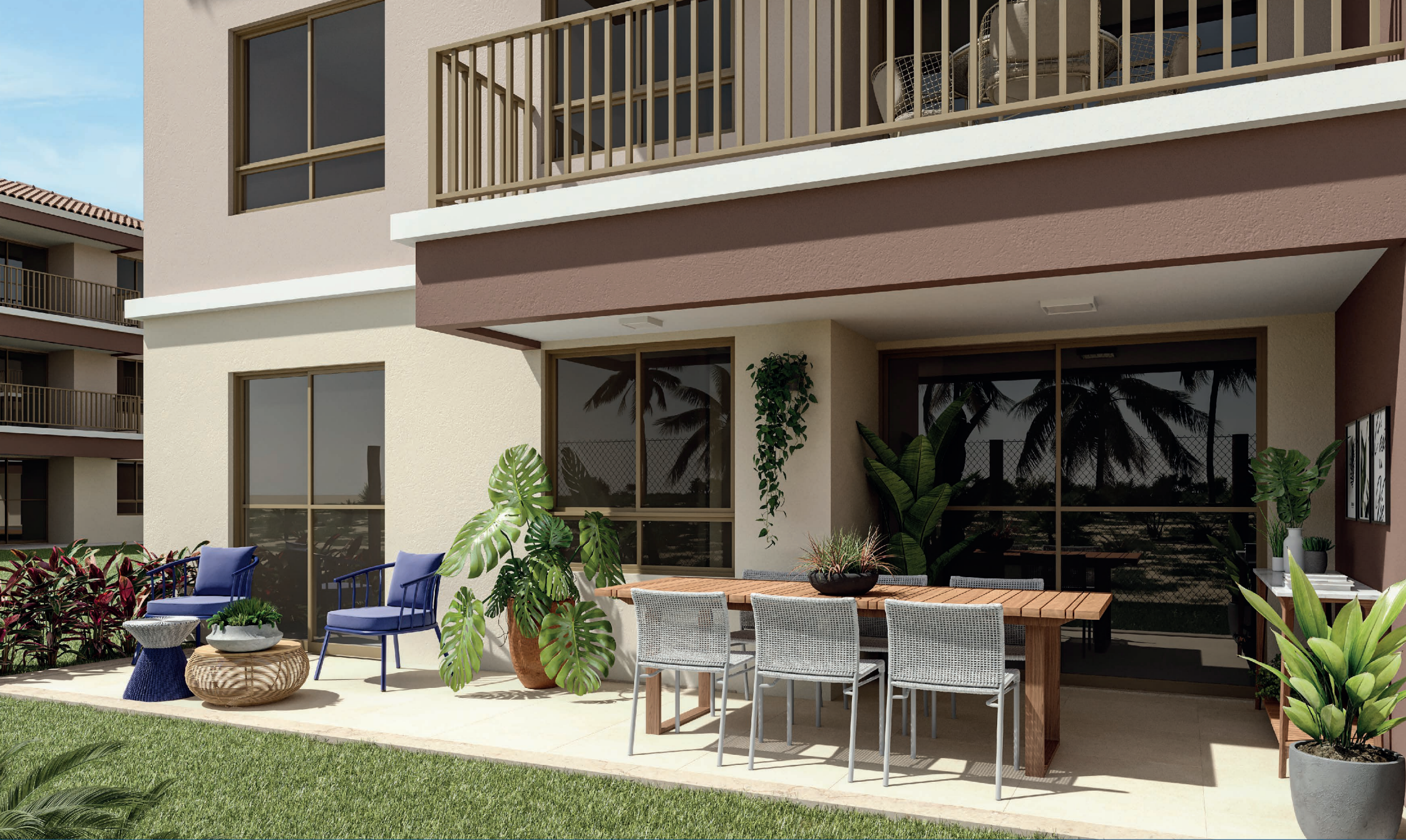
Varanda Térreo 3/4 Tipo D