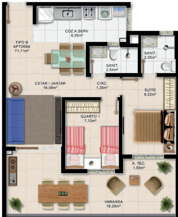
Planta Baixa 2/4 Térreo Tipo B