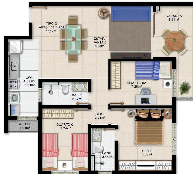
Planta Baixa 3/4 Superior 1º e 2º Pau. Tipo D

*Área total privativa, áreas internas úteis