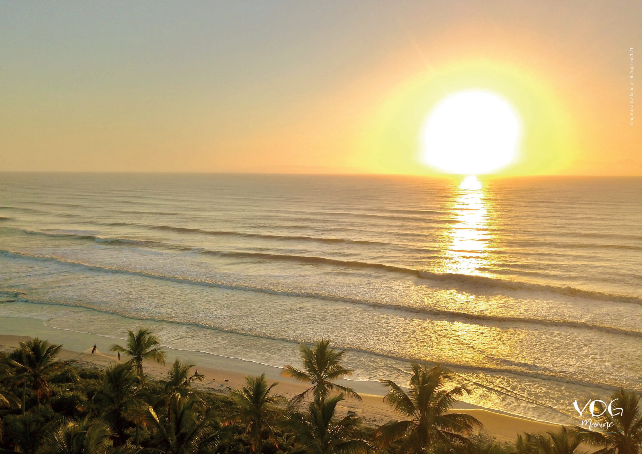
Imagem captada no local Agosto/2021