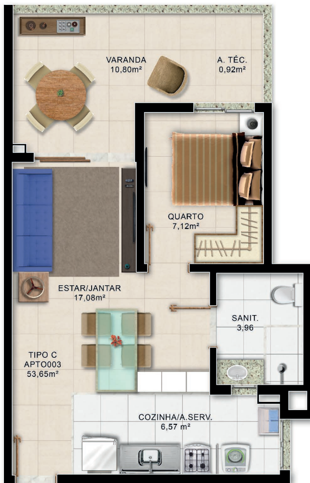
Planta Baixa Quarto e Sala Térreo Tipo C