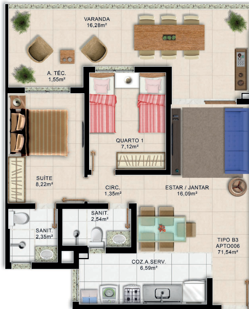
Planta Baixa 2/4 Térreo Tipo B3

*Área total privativa, áreas internas úteis