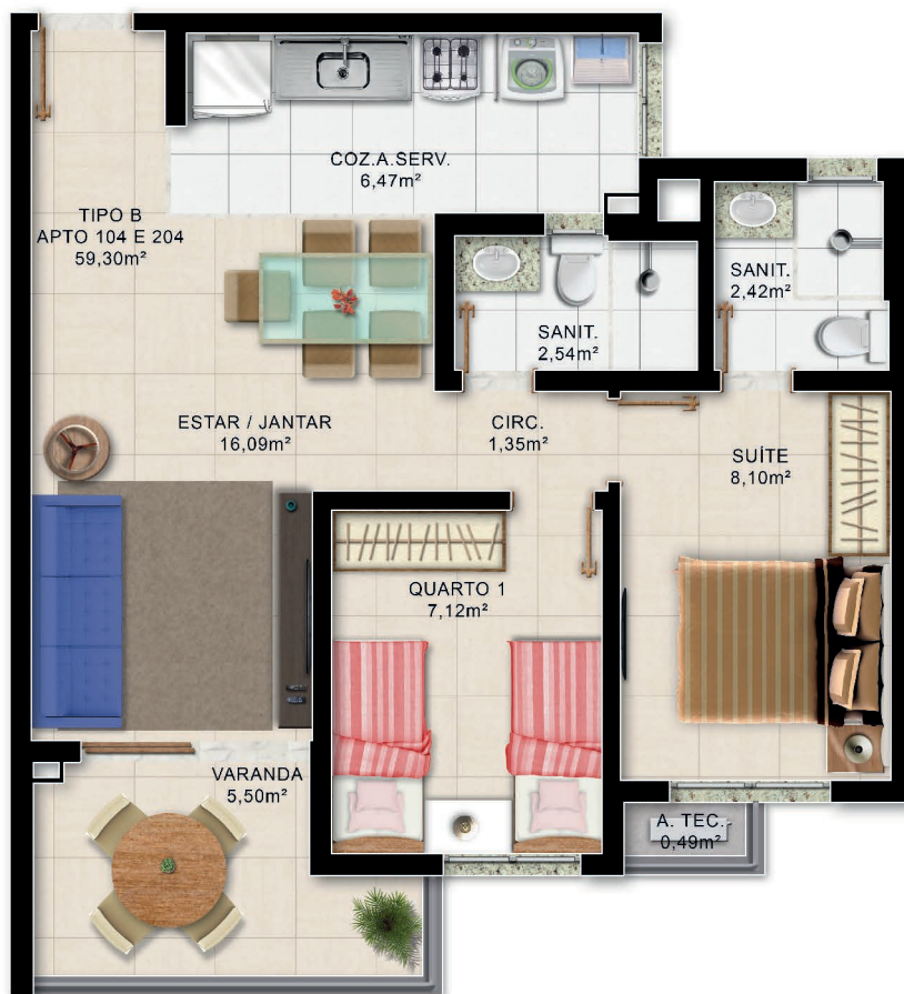
Planta Baixa 2/4 Superior 1º e 2º Pau. Tipo B