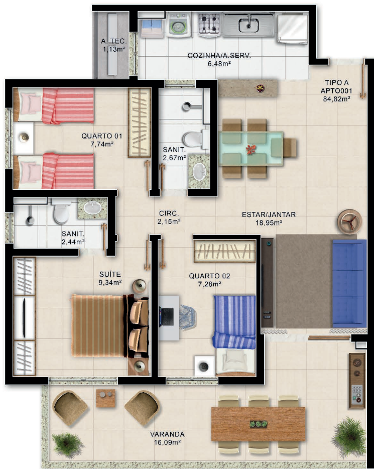
Planta Baixa 3/4 Térreo Tipo A