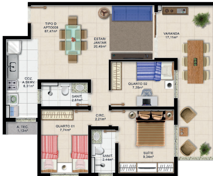
Planta Baixa 3/4 Térreo Tipo D

*Área total privativa, áreas internas úteis