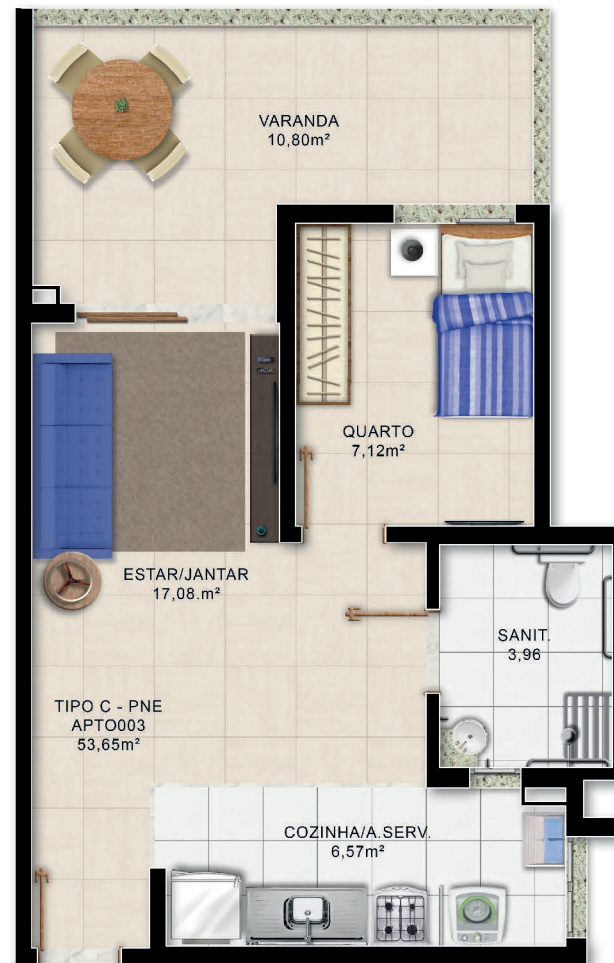
Planta Baixa Unidade Adaptável PNE Tipo C

*Área total privativa, áreas internas úteis