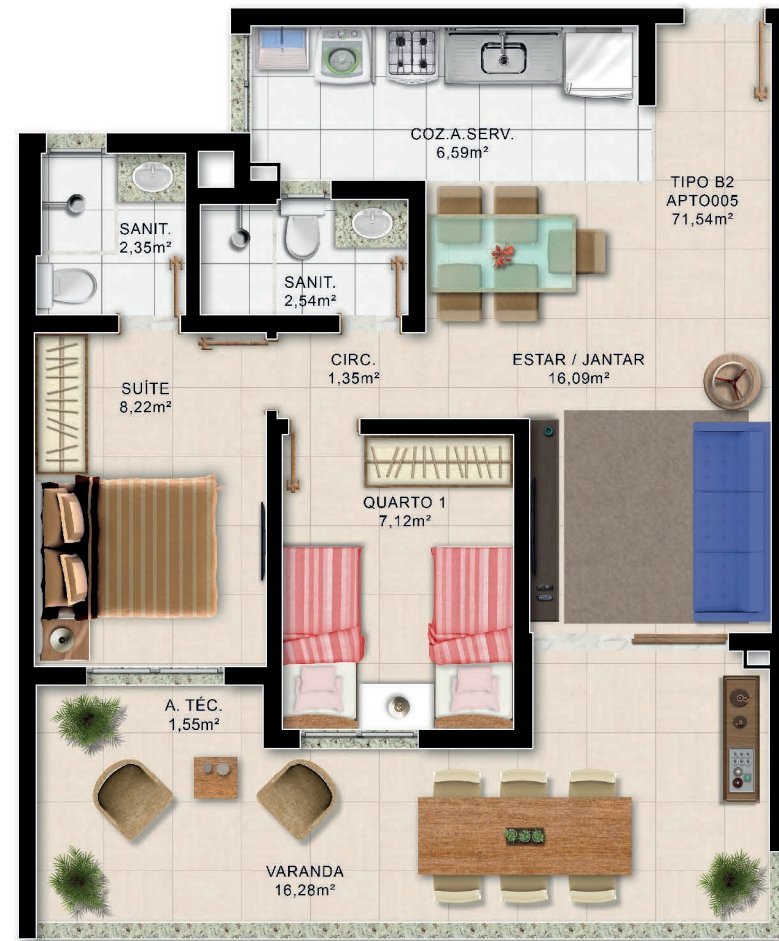
Planta Baixa 2/4 Térreo Tipo B2

*Área total privativa, áreas internas úteis