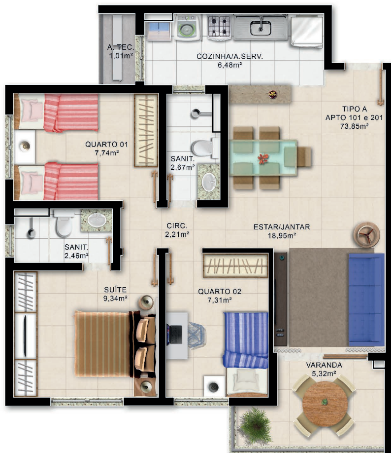
Planta Baixa 3/4 Superior 1º e 2º Pau. Tipo A