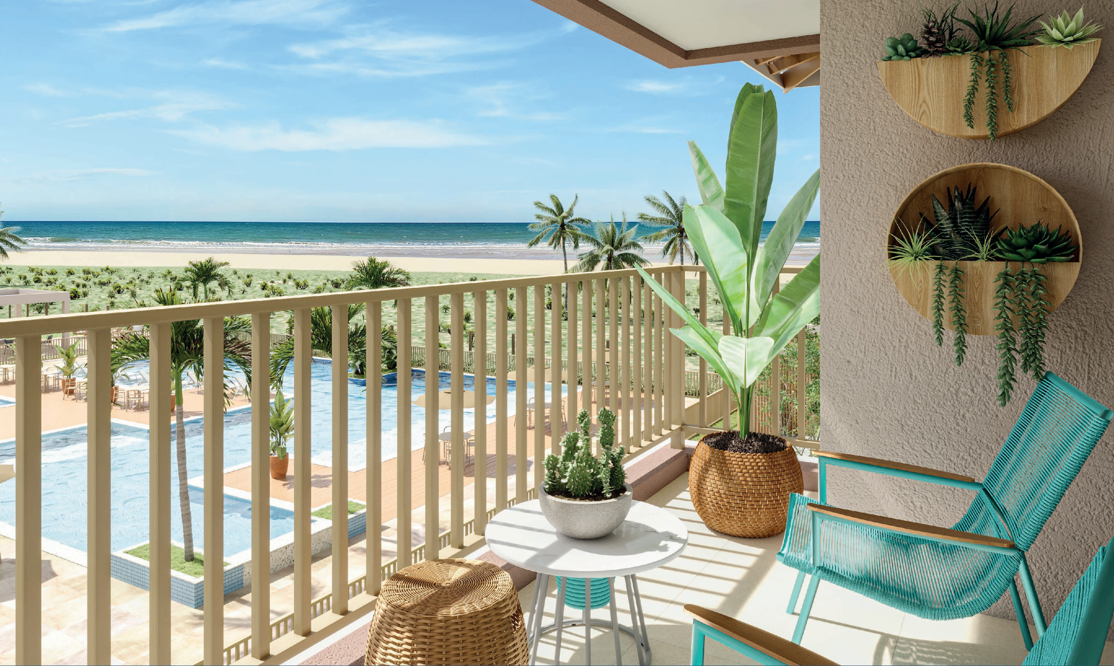
Varanda Superior 2/4 Tipo B2